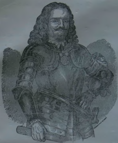
De Ruyter Mihály

holland tengernagy, a magyar gályarabok kiszabadítója.