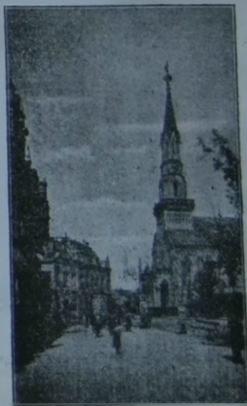
A losonci református templom.

Árvaháza van a jugoszláviai reformátusoknak, pedig csak 50,000 lélekből áll az 53 gyülekezetük.