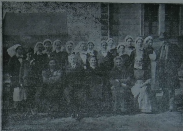
A budapesti Filadelfia (Bethesda) ref. diakonissza intézet igazgató lelkésze családjával és néhány gyönyörű ruhájú diakonisszával.