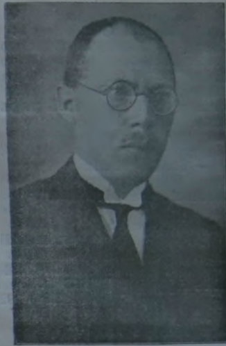
Dr. Makkai Sándor az erdélyi református magyarok tudós püspöke.