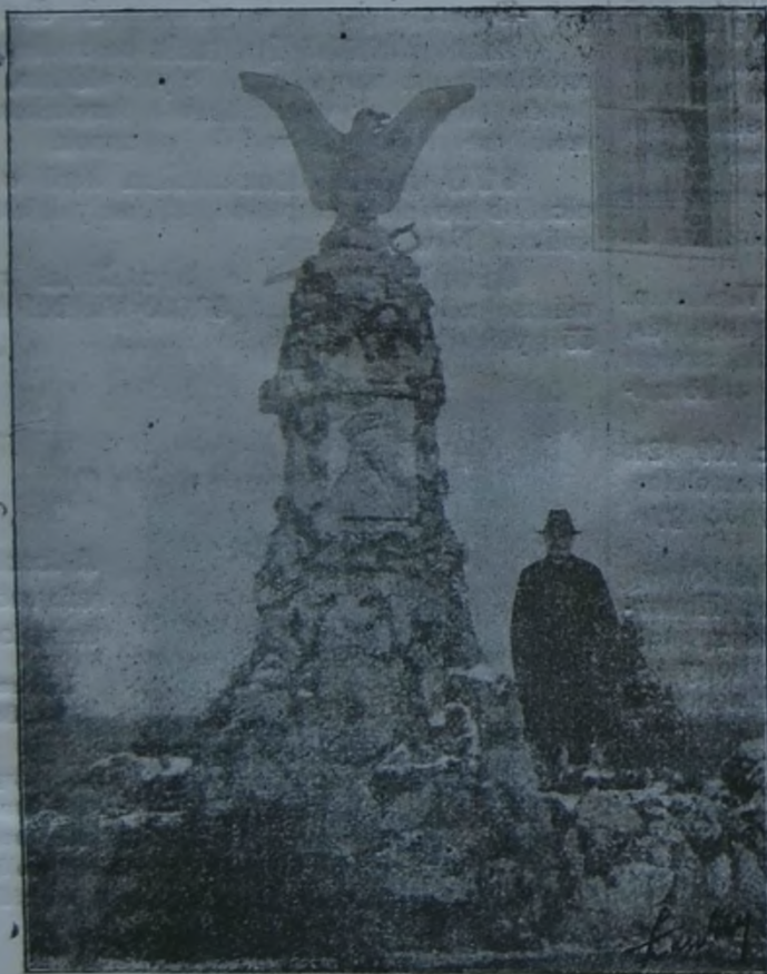
A bánkhorváthi reformáció emlékmű

— Szomorú árvaság. Van gyülekezetünknek egy apátlan-anyátlan árvája. Egy 13 éves lányka. Arcoskaja sápadt. A lelke is szegény. Nincs még csak rendes otthona sem. És nem volna ebédje, sőt éhen halna, ha más vallású jólelkű emberek nem nyújtának neki egy-egy karéj kenyeret. Durva beszédet, lelketlen szavakat hallhat eleget. S az utca romlottsága s az istent nem-ismerők példája őt is körülveszi. Nincs édesanyja, aki könnyeit letörölné, aki megvédené kísértések között. Nincs egy jó rokona, akihez bizalommal elmehetne. . . . Oh mi lesz belőle? . . . Ha mi keresztyének vagyunk, akkor elnézhetjük ezt? Hát nem minket vádol minden árvánk sápadt arca? Mit tegyünk vele? Vagy hidegen hagy minket egy szegény árva sorsa? — Az Úr Jézus azt mondta: „Aki egy ilyen kis gyermeket befogad az én nevemben, engem fogad be.” Máté 18: 5.