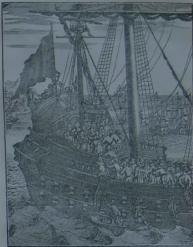
Gálya (tengeri hajó), amelyen a magyar gályarabok szenvedtek.

ezek ellenőrzését, vezetését a ahol az Istenre űhes lelkeket nem elégíti ki a szószéki igehirdetés. Különböen is ez utóbbi esetekben és hogyha nem előzzük meg bibliakörökkel: úgyis lesznek bibliakörök, csak hogy az Egyházat szétépítő szekták vezetése alatt. Ime, láthatjuk most már, hogy a bibliakörökkel egyrészt befelé erősítjük az Egyházat, másfelől kifelé védjük meg a „hamis atyafiaktól”. — A templomban csak a lelkész beszél. Ott nem kérdezhet senki, nem tarthatja fel a lelke baját, az ő kéikedéseit, stb. Ha a testi betegek heletre összejönneek egy nagy terembe, ahol egy orvos hol erről, hol meg amarról a betegségről beszélne s magyarázná a gyógyítás módját, vagy pedig beszélne mindenről, csak a betegségekről nem, akkor sok beteg azt mondaná, hogy az ő bajáról külön is kell beszélnie az orvossal, mert arról nem volt szó. S azért olyan áldásos ma a kórházi gyakorlat, mert ott az orvos közösen kezeli a betegeket, de mindegyiket a maga baja szerint. Valahogy így van ez a bibliakörökkel is. Magyarországon már a lelkészek is tartanak egymásközi több helyen bibliaköröket. Sőt van olyan presbitérium is, mely megszabott időben