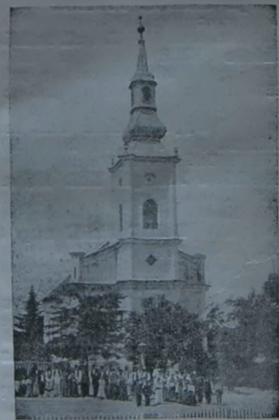
A tordinaei (Szerb királyság) református templom.

Követlek Tégedet, mint hold a napot, hogy a Te kegyelmednek sugárral fényeskedjem. Követlek, mint árnyék a testet, hogy valahová fordulsz, lábaid nyomát szüntelen keressem. Követlek, mint a napkeleti bölcsek a Te csillagodat, hogy előttem menj, míglen megül az én szívemben, ahol Tégedet találjalak. Követlek, mint gyermek az ő atyját, mert ha atyám és anyám elhagy is engemet, de Te felvészsz engemet. Ráday Pál (1677—1733) II. Rákóczi Ferenc kancellárja.