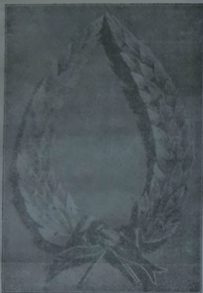
Ez az ezüstkoszorút a magyar ref. Zsinat helyezte el De Ruyter amsterdami sírjára.