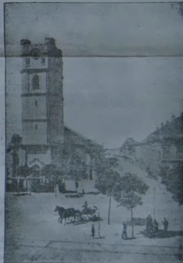
A magyar Genf (Debrecen) „Kis temploma.”