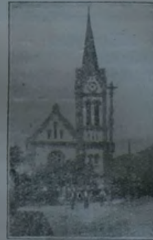
A rozsnyói református templom.

A „Szeretet“ újságról és naptár-ról el ne feledkezzünk!