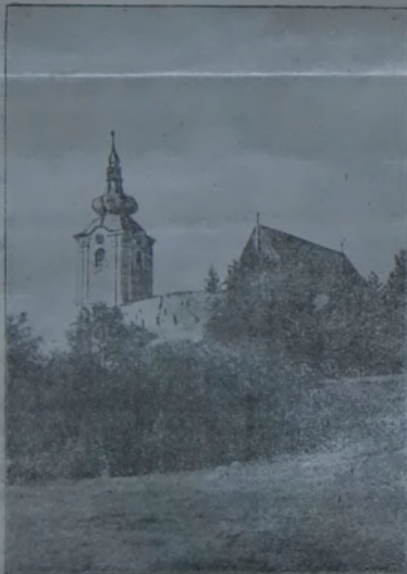
A sepsiszentgyörgyi (Erdély) reformátusok vár-temploma.

táncba kezdett, miközben kiabálva, ordítva, böngve, hörögve fejezték ki fájdalmukat. Egész este, egész éjjel halottl törték-ittak. Éjjel után legmagasabb fokra hágoit az orgo. Részeg volt már mindenki. Nagy, fehér, csunya szemgolyójuk dühös mozgása nem sok jól jövendőt.