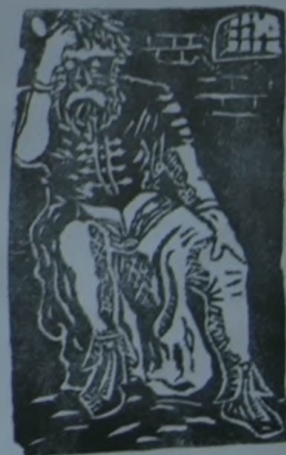
Sáman a börtönben. (A két halálra méltóztat egy komáromi ref. tanács készítette.)