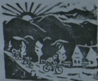
Egy halálra s lelkész által temetett öngyilkosok temetőjének szelvénye.

való s az istenfélő híveknek kijáró temetést, vagyis az öngyilkosokat minden szertartás nélkül temették el. Persze nem is harangoztak rájuk. Sőt nem egy presbiterium csak a temető szélén („árkában") engedte meg az öngyilkosok eltemetését. Több lelkész ragaszkodik ma is ehhez az ősi református magyar álláspont-hoz s nagyon helyesen cselekedve megkülönböztetik az istenfélő, kegyes életű emberek porátorának eltakarításától a hitelenségükéről és istentelen mivoltukról tanubizonyosságot tevo öngyilkosok eltemetését. Ez persze nem az öngyilkos miatt van így, mert az elhalt embernek sem javára, sem kárára nem lehet tenni semmit, hanem ezzel az álláspontjával el akarja itélni az Egyház magát az öngyilkosságot s figyelmeztetni kívánja az élöket arra, hogy milyen rettenetes bűn az öngyilkosság.