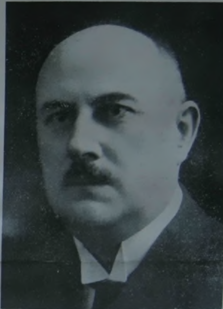
Sörös Béla, püspök.

Sörös Béla püspököt ezután kb. 15 küldöttség üdvözölte, a vallásfelekezetek, az államhatóságok, a különböző egyházi szervezetek stb. Mind-egyik küldöttségnek válaszolt a püspök: méltóságát teljesen, rendkívül találóan és csodálatba ej-