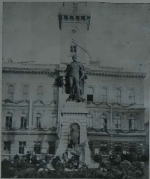
A komáromi Klapka-szobor. Háttérben a városháza.

„Testet öltött tündéralom: Kiskomárom-Nagykomárom...”